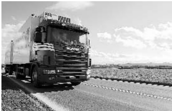
Sur la trentaine de camions contrôlés, trois ont été sanctionnés par les policiers. (a)

La police cantonale bernoise a effectué lundi matin un contrôle systématique des transporteurs de marchandises sur l'autoroute A5, à Boujean. Plusieurs infractions ont été constatées lors de cette opération qui a duré de 8h à 11h45.