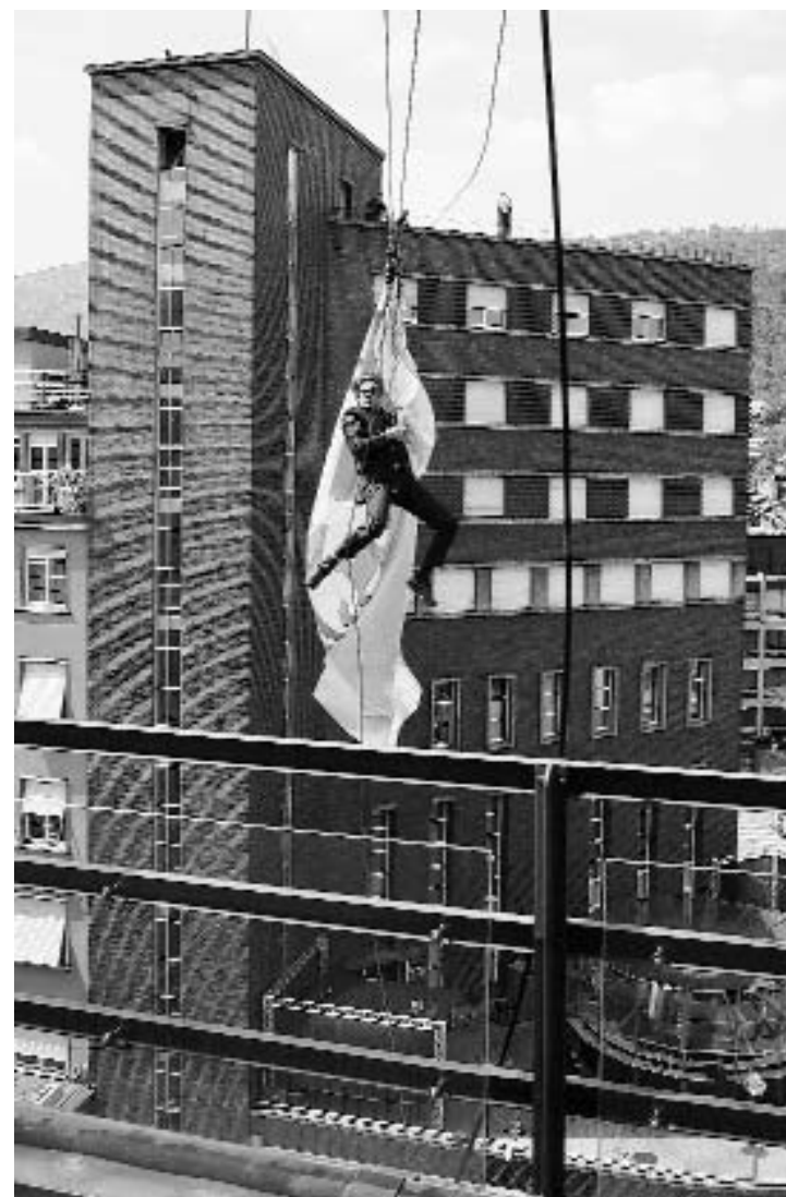
Quatre ans après avoir participé au tournage de «Spiderman», notre cascadeur se prend au jeu.